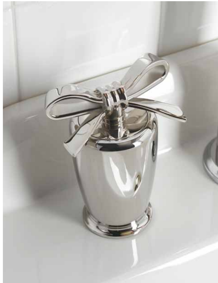
Cromo, per una dolcezza leggera ed essenziale. Chrome for a graceful and simple touch.